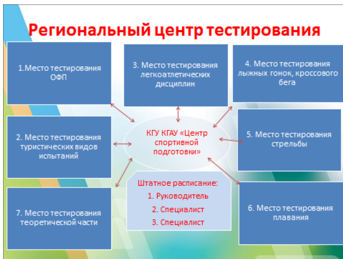
Рисунок 2 – Структура центра тестирования

Примерная структура регионального центра тестирования (рис. 2) состоит из 7 мест тестирования 3 штатных работников.