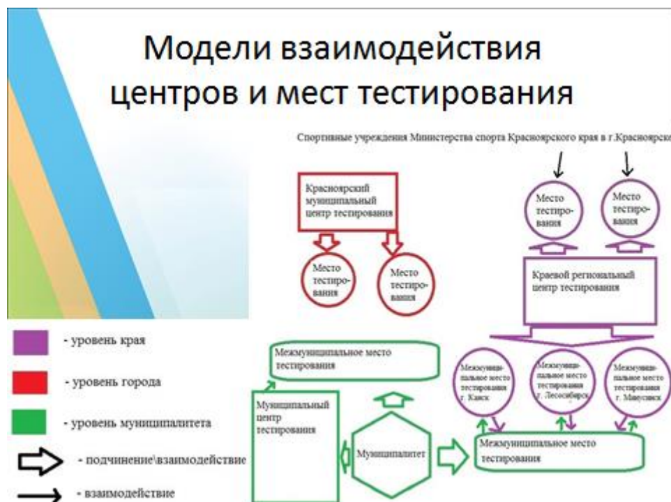
Рисунок 3 – Модель взаимодействия центров и мест тестирования

Модели взаимодействия центров и мест тестирования (рис. 3)