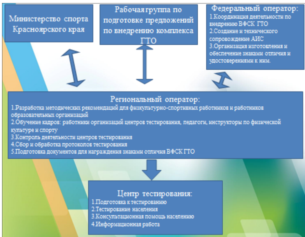
Схема 1 – Взаимодействие регионального оператора.

Региональный оператор внедрения комплекса ГТО взаимодействует с органами местного самоуправления по оснащению Центров тестирования необходимым инвентарем и оборудованием, учетными карточками выполнения нормативов и государственных требований комплекса ГТО;